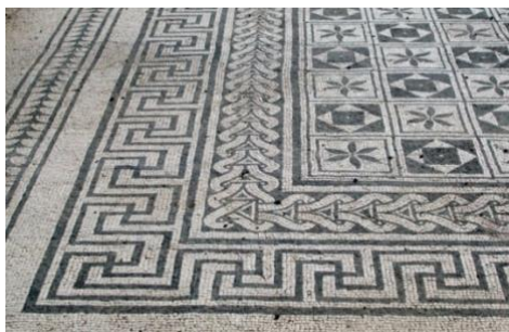
Villa Romana –Russi

Ai richiedenti seguirà l'invio del LINK di collegamento alla piattaforma ZOOM con il proprio apparato PC-TABLET- SMARTPHONE, alla mail che sarà indicata nel Modulo B.